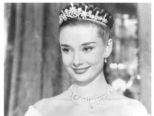
«Roma tətiləri» filmindən fraqment

inqilabı dövrünün məşhur siyasi xadimi; 20.Yunanıstanda şəhər; 21.İspaniya və Portuqaliyada geniş yayılmış kişi adı. Pyotr adının analoqu. Soldan sağa: 1.Dövlət idarəetməsində münasibətlər sisteminin bir forması. Daha çox avtoritar rejimlərdə tətbiq edilir; 8.Subekvatorial qurşaqla ot örtüyünə və seyrək ağac və kollara malik geniş ərazi; 9.Hər hansı bir şirkətin məhsullarını topdan alıb, sonradan pərakəndə və kiçik topdan satılması ilə məşğul olan hüquqi və ya fiziki şəxs; 10.Süd məhsulundan hazırlanmış sərinləşdirici içki; 11.ABŞ-da ştat; 12.Cinayətkarlardan, quldurlardan təşkil olunmuş dəstə. Hindistanda şəhər; 14.Alcəq yerləri su basmaqdan qorumaq, sututarlarda isə suyu saxlamaq və s. üçün quraşdırılan hidrotexniki qurğu (bənd); 19.Məşhur Amerika