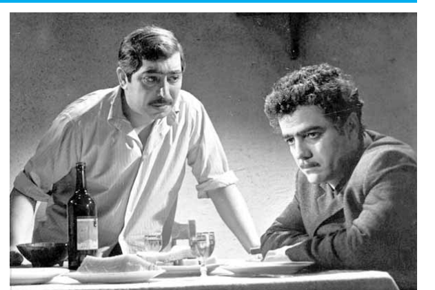
«Bir cənub şəhərində» filmindən epizod

Yuxarıdan aşağı: 1.Riyaziyyatçı alim, Kaliforniya Universitetinin professoru; 2.Futbolda vəziyyət; 3.Pişikimilər fəsiləsinin qar bəbirləri cinsinə aid heyvan növü; 4.Qədim Roma memarlığında kirayə üçün nəzərdə tutulan çoxmərtəbəli yaşayış evi; 5.Hicri təqvimində aylardan biri; 6.RF-nin Kalininqrad vilayətində şəhər; 7.Yamaykada 290 km şimal-qərbdə yerləşən ada; 13.Avropanın əksər ölkələrinin ümumi pul vahidi; 15.Formula-1-in alman pilotu; 16.Kiçik Asiyada antik şəhər; 17.Tibdə, xüsusilə psixiatriyada hərəkət pozğunluğunun bir növü. Hərəkətsizlik, taqətsizlik, halsızlıq, qıçığa qarşı reaksiya sönlüklüyü; 18.Bir sıra ölkələrdə xırda pul vahidi; 20.Xəzər dənizində yerləşən, Azərbaycana məxsus ada; 21.Polineziya xalqı. Soldan sağa: 1.Elektrik dövrəsində gərginliyi sabit saxlayan yarım-keçirici cihaz; 8.İctimai nəqliyyat növü; 9.Qıpçaq əsilli Qızıl Orda sərkərdəsi; 10.Yunanstanın cənub-qərbində şəhər; 11.İsveçrənin cənub-qərbində şəhər; 12.Azərbaycan kinorejissoru, ssenaristi, Azərbaycan SSR Dövlət mükafatı laureatı (1978), Azərbaycanın xalq artisti. «Bir cənub şəhərində», «Babək», «Nizami» kimi populyar filmlərin rejissorunun adı; 14.Heyvan növü; 19.Orta əsrlərdə Avropada əmlakın (əsas etibarilə torpaq mülkiyyətinin) yalnız böyük oğula, ya da nəslin ağsaqqalına keçməsi haqda varislik qaydası; 21.Tamıma-maq və ya müdafiə məqsədi ilə üzə geyinilən əşya; 22.RF-nin Yaroslavl vilayətində çay; 23.Mübahisə, müzakirə, disput və s.