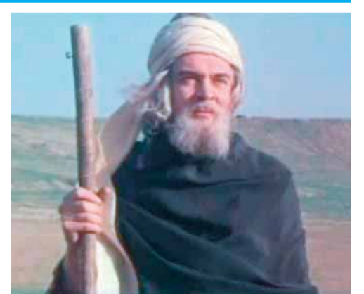
«Nizami» filmindən fraqment (1982)

nin Kitabxanaşünaslıq kafedrasının müdirinin adı; 17.İnternaturanı keçən tələbə; 18.Nazik, yarımşəffaf parça; 20.Türkiyənin «Trabzonspor» komandasında hücumçu mövqeyində çıxış edən əslən azərbaycanlı futbolçunun adı. Hazırda Rusiyanı təmsil edir; 21.Rusiya Federasiyasının Kareliya Respublikasında çay. Soldan sağa: 1.Firmaların birləşməsi; 8.Venesuelanın paytaxtı; 9.Rusiyada çay; 10.Tanrının mövcudluğunu və kainatın onun tərəfindən yaradıldığını etiraf edən, lakin tanrının insanlara və təbiətə müdaxiləsini, dinlərin tanrı tərəfindən yaradılmasını inkar edən təlim; 11.Həndəsi fiqur; 12.Mərkəzi Afrikada dövlət; 14.Qədim yunan mifologiyasında hər b və zəfər, eləcə də müdriklik, bilik, incəsənət və sənətkarlıq ilahəsi; 19.İfaçılıqda səs diapozonu; 21.Əsərlərini alman dilində yazmış yəhudi əsilli yazıçı; 22.Rusi-