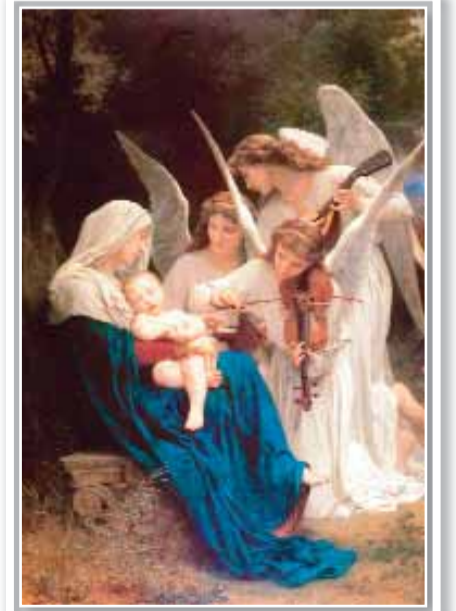
«Mələklər mahnısı». Vilyam Buqro. 1881-ci il.

dövlət tərəfindən birgə idarə olunması; 8.Dünyanın ən məşhur universitetlərindən biri; 9.Şair-dramaturq, türkmən, Azərbaycanın Əməkdar incəsənət xadiminin adı; 10.Azərbaycan yazıçısı, dramaturqu və kinossenaristi. Həşən Seyidbəyli ilə birgə eyniadlı roman əsasında yazdıqları ssenari üzrə çəkilən «Uzaq sahillərdə» filmi xüsusilə geniş şöhrət qazanıb; 11.Sement istehsalında istifadə olunan qarışıq; 12.Kambocanın əsas dili, Asiyanın ən çox yayılmış dillərindən biri; 14.«Məhəllə» filmində Məzi obrazını canlandıran aktyorun adı; 19.Anqolada geniş yayılmış xalq; 21.İtaliyanın Latina vilayətində liman şəhəri; 22.Anartidinin qərbində yerləşən 1980 metr hündürlükdə dağ; 23.Gürcü əsilli sovet və rus rəssamı, heykəltaraşı, Rusiya Rəssamlıq Akademiyasının prezidentinin soyadı; 24.Astara rayonunda kənd; 25.Fizika elminin metod və yanaşmalarından istifadə etməklə canlılar aləmini öyrənən elm.