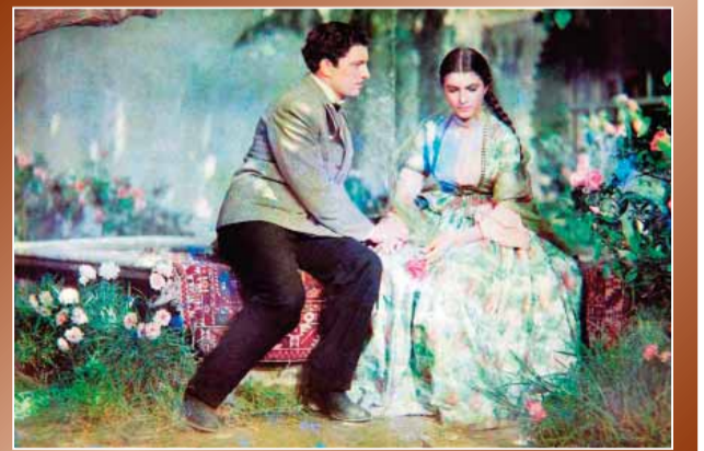
«O olmasın, bu olsun» filmindən epizod

Soldan sağa: 1.Geniş yayılmış antibiotik; 8.İçərişəhər XIV əsrə aid tarixi məzarlıq abidəsi olan restoran kimi fəaliyyət göstərən karvansaray; 9.XV-XVII əsrlərdə Rusiyada feodal və mülkədarların zülmündən uçarlar (Don, Yaik, Zaporozje) qaçır azad olmuş təhkimli kəndlilərə, nökrələrə və səhər yoxsullarına verilmiş ad; 10.Ədəbiyyat termini: hər beytin axırında qafiyədən sonra təkrar edilən söz və ya söz birləşməsi; 11.Təyyarə ilə uçuşdan qorxan şəxs; 12.Antarktidada ən uzun çay, həmçinin mineral adı; 14.Vətəni Amerika olan qəhvə içkisi; 19.Həndəsi fiqur; 21.İsa peyğəmbərin doğum günü ilə bağlı qeyd edilən bayram; 22.1515-1920-ci