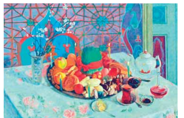
«Novruz sevinci». Vaqif Ucatay

sinin müəllifi. Soldan sağa: 1.Yunan mütəfəkkiri. Millet məktəbinin nümayəndəsi; 5.Məməlilər sinfinin xortumluqlar dəstəsindən heyvan; 7.Qış Olimpiya idman növü; 8.Azərbaycan şairi, yazıçı, dramaturq, publisist, pedaqoq, ədəbiyyatşünas, tərcüməçinin adı; 10.Hindistanda şəhər; 11.Nazik bağırsağın iltihabı; 12.Buryatiya ulusu; 14.Portuqaliyada şəhər; 19.Karib dənizində ada; 21.Azərbaycanın xalq şairinin adı; 22.Ərəbcə hörmət ifadəsini bildirən titil. «Lider» və ya «vali» mənalarını