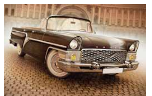
Az sayda istehsal olunan sovet avtomobili

anası; 18.Beynəlxalq foto agentliyi; 20.Üzərində silahlı adam şəklində olan kart; 21.Azərbaycanın məşhur gülüş ustası. «Nəsrəddin Xocanın 12 məzarı» bədii filmində (1966) baş rolun ifaçısının adı. Soldan sağa: 1.Gözlə görünməyən obyektə baxmaq üçün böyüdücü şüşələr sistemi olan optik cihaz; 5.Ud tipli alətlər qrupuna daxil olan qədim simli çalğı aləti; 7.Hər hansı mənbədəki işığın gücünü müəyyən etmək üçün cihaz; 8.Şəfqətli, mehriban, meyl edən, sevən, bəyənən; 10.Azərbaycandan görünən ekvatorial bürc; 11.Böyük Britaniyada şəhər; 12.Ensi, dərin, yamacları dik və qayalıq dəniz kərfəzi; 14.Sovet vaxtında az sayda istehsal olunan QAZ-13 representativ avtomobilin adı; 19.Azərbaycan Respublikasının əməkdar rəssamı, Naxçıvan Rəssamlar Birliyinin sədrinin adı; 21.Cinayətkarlar, quldurlar dəstəsi; 22.Elektrik