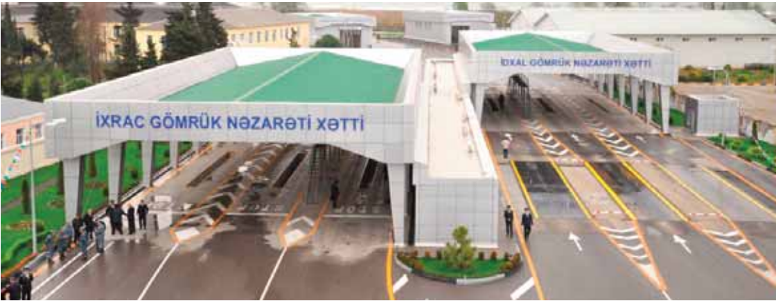
2017-ci ilin birinci rübündə Azərbaycandan xarici ölkələrə 273 milyon 554 min dollar həcmində qeyri-neft malları ixrac olunub ki, bu da ötən ilin müvafiq dövrü ilə müqayisədə 11,8 faiz çoxdur

nin tətbiqi milli ixracın səviyyəsinin yüksəlməsinə imkan verir: «Xüsusilə də qeyri-neft sektoruna dövlət dəstəyinin artırılması və məhsulların istehsalının və ixracının artmasına səbəb olub. 2017-ci ilin birinci rübündə Azərbaycandan xarici ölkələrə 273 milyon 554 min dollar həcmində qeyri-neft malları ixrac olunub ki, bu da ötən ilin müvafiq dövrü ilə müqayisədə 11,8 faiz çoxdur. İxrac olunan əsas mallar kimya sənayesi məhsulları, fin-diq, pambıq lifi, təzə və ya so-yudulmuş tomat, şəkər, alüminium, xurma və almadır».