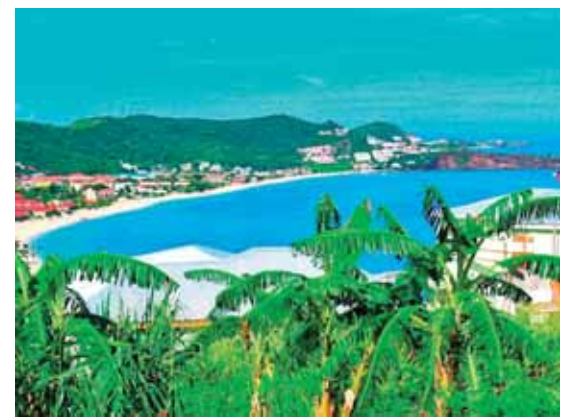
Qərəib dənizinin cənub-şərqində ada

Yuxarıdan aşağı: 1.Saz havası; 2.Respublikamızda keçiriləcək beynəlxalq yarış; 3.Şümerdə ən qədim şəhərlərdən biri; 4.Tuamotu (Fransa Polineziyası) arxipelaqında atoll; 5.Ümumdünya Vəhşi Təbiəti Mühafizə Fondunun (WWF) loqotipində əks olunan məməli heyvan növü; 6.Təqvimdə ilin ilk ayı; 9.Məşhur avtomobil markasının azərbaycanca deyiliş forması; 13.Üzərində vaqon, vaqonət və s. təkərlərinin hərəkət etdiyi polad yol; 15.Böyük Britaniyada fəxri titül; 16.Qədim türk dilində vergi və mükəlləfiyyətdən azad olunmuş rəiyyət; 17.Qazax rayonunda çay. Kürün sağ qolu; 18.Qədim yunan mifologiyasında titan tanrı; 20.Rusiya Federasiyasının Xabarovsk vilayətində çay; 21.Üst paltar üçün naxışlı yun parça materialı. Soldan sağa: 1.İşıq mənbəyindən çıxan şüaları əks etdirən cihaz; 5.Bir neçə adam arasında bölünən şeydən hər birinə düşən hissə; 7.Türkiyədə gündəlik ictimai-siyasi qəzet; 8.Monqolustanın şimal-şərqindən keçən çay; 10.Sakit okeanda ada dövlət; 11.Qərəib dənizinin cənub-şərqində ada; 12.Qədim Misir mifologiyasında hamilə qadınların və körpələrin himayəçisi; 14.Fransa rəssamı, postimpressionizm və primitivizm cərəyanının nümayəndəsi; 19.Yunan mifologiyasında işıq, kəhanət, şeir və musiqi tanrısı. Həmçinin ABŞ-da NASA tərəfindən həyata keçirilmiş Aya uçuş layihəsinin və kosmik aparatın adı; 21.Türkiyədə şəhər; 22.Saç boyamaq üçün bitki yarpaqlarından hazırlanan toz; 23.Ordubad rayonu ərazisində dağ;