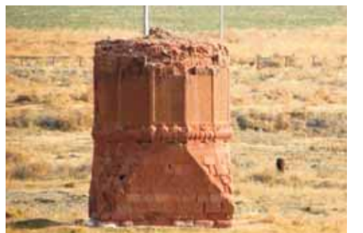
Culfa rayonu ərazisində yerləşən türbə

cə» nağıllarının süjetləri əsasında yaradılmış baletin müəllifi; 20.Lerik rayonunda kənd; 21.İdarənin, müəssisənin və s. adı olan möhür. Soldan sağa: 1.Mammot cinsinə aid olan nəsil kəsilmiş xorutumlu heyvan; 5.Yunan hərfi, psixologiya elminin simbolu; 7.XIII əsr Azərbaycan memarlığının ən maraqlı nümunələrindən biri, Culfa rayonu ərazisində yerləşən türbə; 8.1921-ci ildən nəşr edilən rusdillilik mərkəzi qəzetin adı; 10.Oksidlər sinfinə aid dəyərli mineral daş. Qədim dövrlərdə ləl, yaxont adlanırdı; 11.Yuxarıya doğru gədikcə nazikləşən, yonulmuş daş sütundan ibarət abidə; 12.Çexiyanın paytaxtı; 14.S.Vurğunun poeması; 19.Göygöl rayonunda kənd; 21.Tanınmış Azərbaycan aktyoru, rejissoru, xalq artisti-nin adı. Bir sıra musiqili komediya və ope-