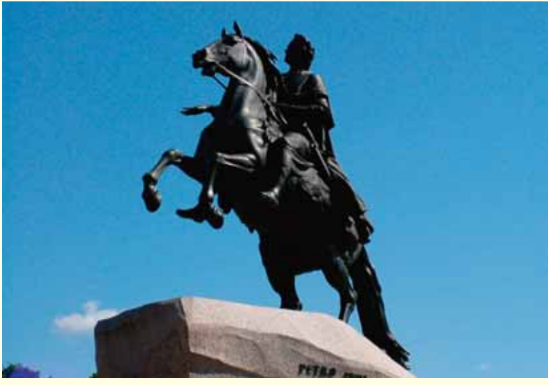
Etyen Moris Falkonye. «Tunc atlı».

Avropanın iri dövlətlərində, həmçinin Fransada mütləq hakimiyyətin bərqərar olduğu şəraitdə fransız incəsənətinin novator ruhu parlaq şəkildə nəzərə çarpmağa başladı. XVII əsrdə mərkəzləşdirilmiş vahid milli dövlət yaratmaq üçün feodal pərakəndəliyinin qalıqlarına qarşı mübarizədə Fransa burjuaziyası öz qüvvələrini Kral hakimiyyəti ilə birləşdirmişdi. Klassisizm - məhz mütləq monarxiya dövrünün məhsuludur. Mütləq monarxiyanın mədəni siyasəti və onun estetik doktrinası olan klassisizm sinfi xarakter daşıyırdı. XVII əsrin ikinci yarısında klassisizm mütləqiyyətin şəhərlənməsinə xidmət edən res-