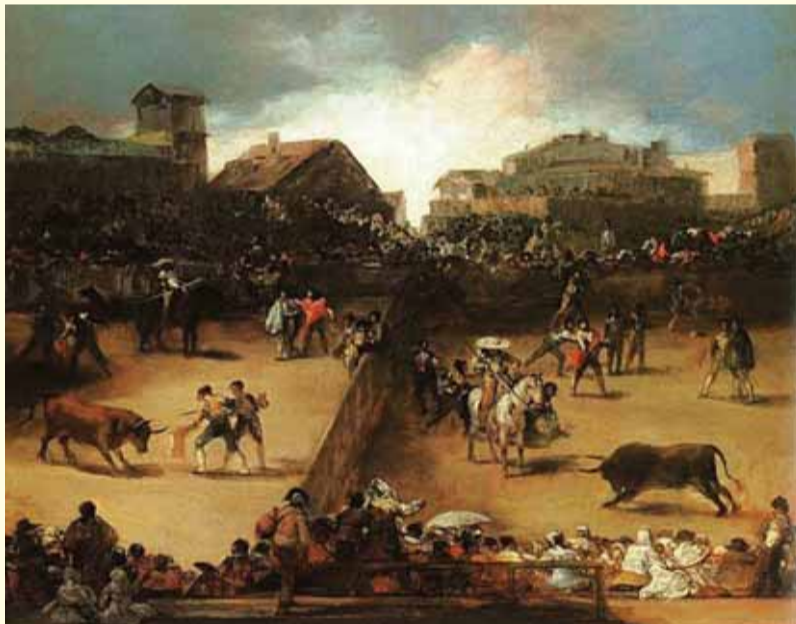
Fransisko Qoyya. «Öküz döyüşü».

Romantizm (fransızca romantisme) 18-19-cu əsrin əvvəllərində Avropa və Amerika mədəniyyətində mövcud olan ideya və bədii düşüncə hərəkatı idi. Bu hərəkat 20-ci əsrin əvvəllərində Azərbaycan mədəniyyətində (xüsusilə ədəbiyyatda) də qabarıq şəkildə təzahür etmişdir. Romantizm şəxsiyyətin nəhayətə qədər azadlığını, kamilləşmə və yeniləşmə ehtiraslarını, fərdi və vətəndaş azadlıqlarını tərənnüm edirdi. İdealın və varlığın əzabverici məhvi romantizm dünyagörüşünün əsasını təşkil edir: romantiklər insanın yaradıcı və mədəni dəyərlərini təs-