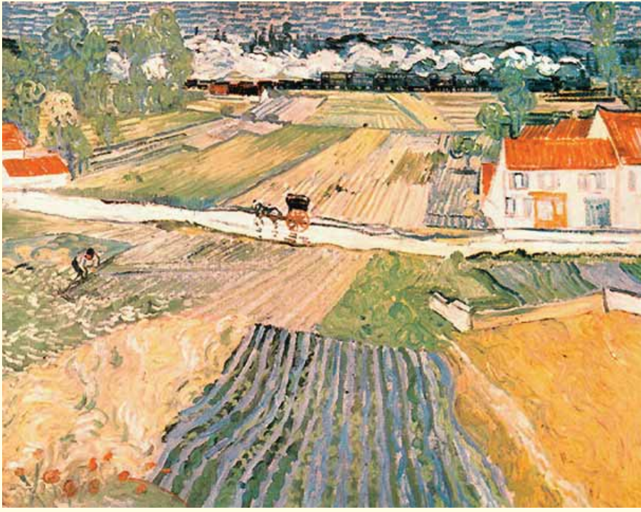
Van Qoq. «Overdə yağışdan sonra mənzərə» (1890).

Dahi holland rəssamı, postimpressionizm cərəyanının yaradıcılarından olan Van Qoqun (1853-1890) yaratdığı 3000-ə yaxın rəsmdən də ən məşhurları rəssamın həyatının son iki ilini əhatə edir. Dünya rəssamlıq sənətində xüsusi yer tutan Van Qoqun ömründə bu iki il streslərlə, kəskin həyat və yaradıcılıq dramları ilə müşayiət olunmuşdur və o, intihar etmişdir (rəssamın ölümü ilə bağlı başqa