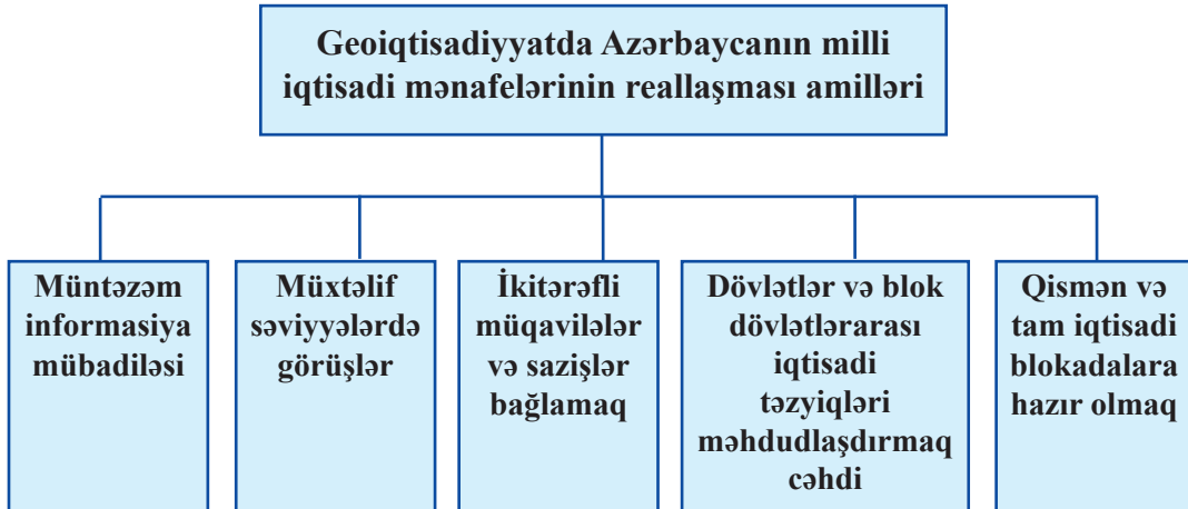
Sxem 3. Geoiqtisadiyyatda Azərbaycanın milli iqtisadi mənafeələrinin reallaşması amilləri

Milli iqtisadi mənafeələrin reallaşmasının mühüm ümumiləşmiş göstəricisi ölkədə ÜDM-in artımı hesab edilə bilər ki, bu da bütün ölkə vətəndaşlarının və təsərrüfat subyektlərinin iştirak səviyyəsini göstərir. Bunu Cədvəl 1-dən də görmək olar.