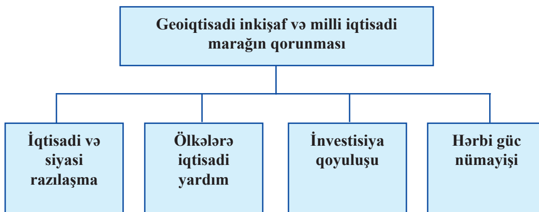
Sxem 1. Geoiqtisadi inkişaf və milli iqtisadi marağın qorunması

Fikrimizcə, milli iqtisadi mənafeələr əbədi olmasa da, hər halda təbii və obyektiv haldır. Çünki coğrafi-iqtisadi amillər dəyişməz, əbədi amillərdir. Buna görə də hər bir sonrakı nəsil həmin problemlərlə üzləşəcək, onların həlli yollarını axtarmalı olacaqdır. Müasir reallıq göstərir ki, Qərbin Yaxın Şərqdə və ərəb dünyasında geoiqtisadi inkişaf baxımından müəyyən strateji marağı vardır. Qərbin adı çəkilən regionlarda daimi iqtisadi fəaliyyəti onun strateji marağı ilə bağlıdır. Həmin strateji maraq Sxem 1-də təqdim edilmişdir: