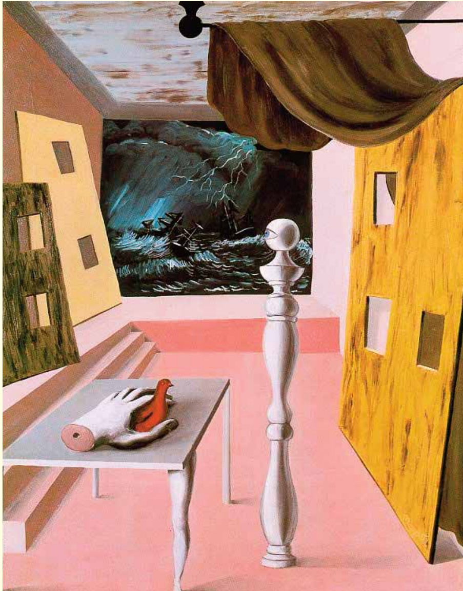
Maqrit Rene. «Çətin keçid» (1926).

Fransada ötən əsrin əvvəllərində, birinci dünya müharibəsinin ab-havasında təşəkkül tapmış sürrealizm (fövqəladə) cərəyanının nümayəndələri instinktləri bədii yaradıcılığın başlıca mənbəyi və estetik prinsipi sayırdılar. Yazıçı A.Brentonun təşəbbüsü ilə meydana gəlmiş sürrealizm üçün qoribəlik, irrosional-